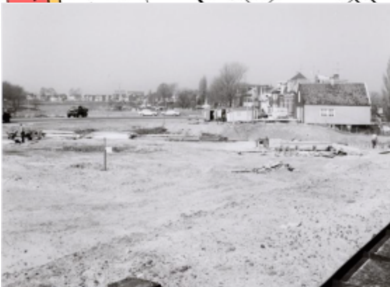
Buurtbewoners vinden dat van het huidige fietspad een rijweg gemaakt moet worden en dat voor de huizen ruimte gemaakt moet worden voor parkeren en spelen, ongeveer zoals de situatie is aan de andere kant van de draaibrug. Dat de ondergrond te zacht is geloven zij niet, gezien deze foto uit 1956 toen hier een dikke laag zand werd afgegraven.