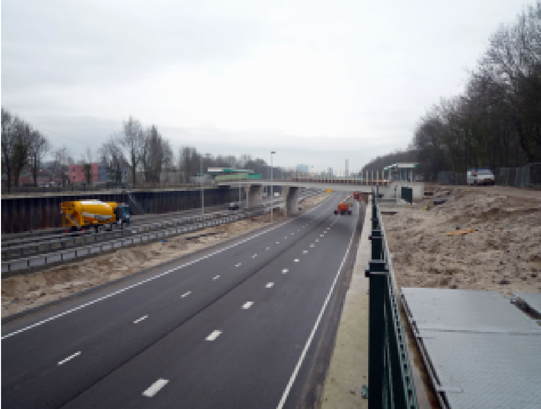
Het lange viaduct zoals het er nu bijligt.