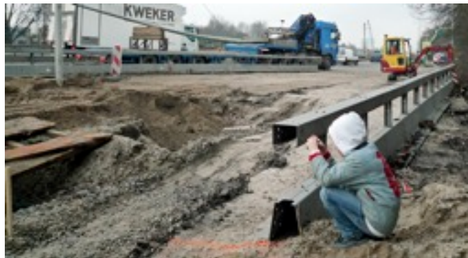
De plaats van het landhoofd van het viaduct is al met paaltjes en oranje strepen aangegeven.

Als de NZIjn in 2010 met het civiele werk klaar is, wordt het park aangelegd, bij voorkeur in de winter van 2010-2011, schrijft De Wild Propitius. Ook de bruggen over het kanaal, zet hij erbij. Hij zwijgt over de viaducten over de NLW.