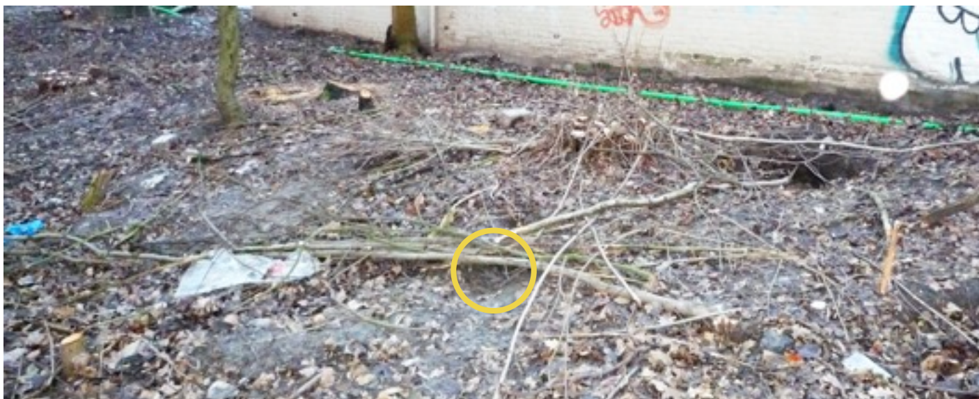
De konijnenholen waren gemarkeerd, maar alles in de omgeving is evengoed gekapt. De aanne-mer heeft een paar essentakken over de ingangen gelegd, want deze bast vinden ze lekker. Als u goed kijkt ziet u in de cirkel een konijn in een ingang van zijn hol. Echte boomrillen zouden volgens onze deskundigen pas echt goed voor de konijnen zijn geweest. De natuurwaarde is afgenomen, maar zal, schrijft de stadsdeelwethouder, als het park klaar is weer snel terug komen.

Wij hebben moeite met het viaduct. Hij ligt hoog, maar hoe hoog? Toezeggingen dat het viaduct 60cm lager wordt zien we in de bouwvergunning niet terug. De aansluitingen op de Buiksloterdijk en de Waddendijk zijn problematisch en nog steeds open vragen.