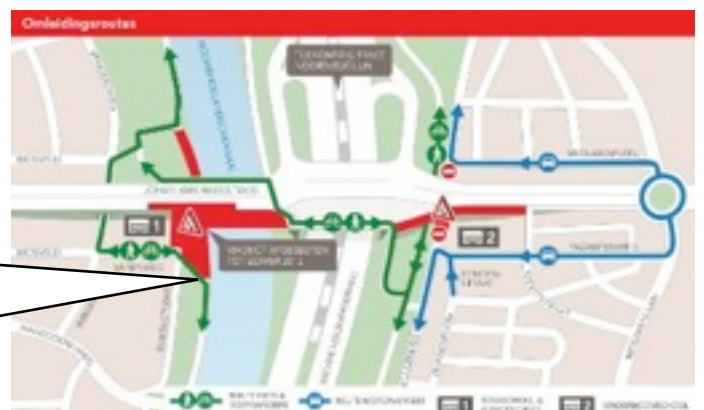
Het officiële olifantenpad bij de Rosaschool.

Aan de andere kant van het kanaal moeten fietsers ook van het fietspad af, maar er is wel een doorgang (niet voor auto's). Zie hetzelfde kaartje van DIVV.