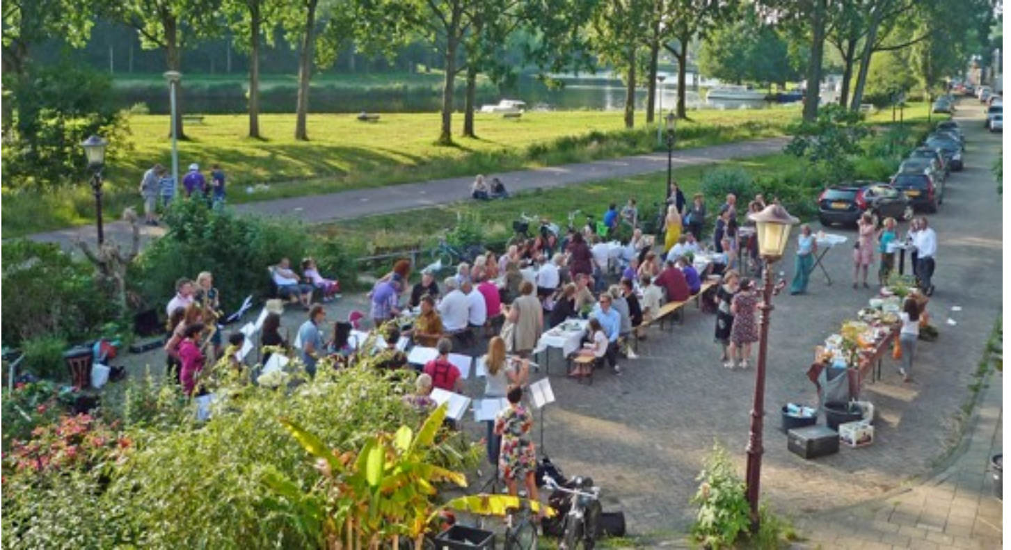
Het dijkdiner vond op een zon overgoten avond plaats. Met vrolijke muziek en heerlijk eten.