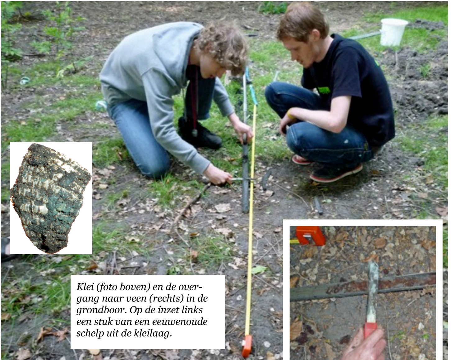
Klei (foto boven) en de overgang naar veen (rechts) in de grondboor. Op de inzet links een stuk van een eeuwenoude schelp uit de kleilaag.